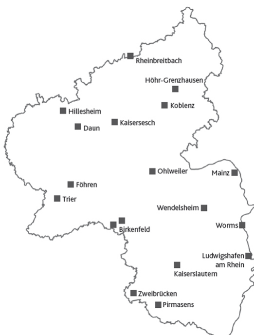
Regionale Verteilung der Technologie- und Gründerzentren in Rheinland-Pfalz

nutzen – solange, bis sie ihre wirtschaftliche Existenz so weit gefestigt haben, dass sie ihre Tätigkeit außerhalb des Zentrums eigenständig fortsetzen können. Durch die Einrichtung von Technologiezentren in allen Oberzentren des Landes Rheinland-Pfalz sowie der Errichtung von weiteren Gründungs- und Innovationszentren ist in den vergangenen Jahren ein flächendeckendes Angebot für technologieorientierte Gründerinnen und Gründer mit Ausstrahlung auch auf den ländlichen Raum entstanden. Die Zentren des Landes stehen dabei in einem engen Verbund mit einer Vielzahl von regionalen, nationalen und internationalen Partnerinnen und Partnern der Forschungs- und Wirtschaftsförderung.